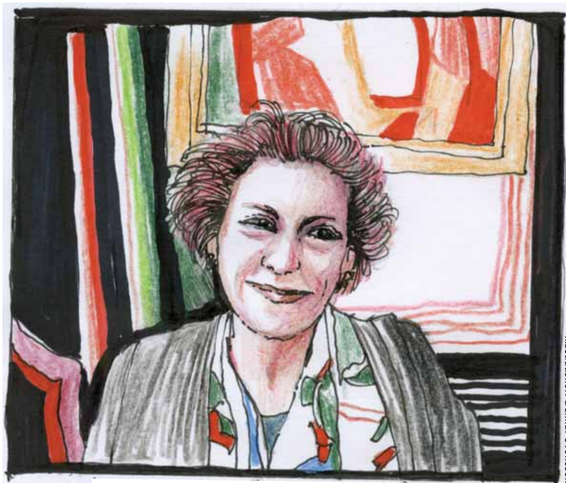
Illustrationer: Gunnar Svensson