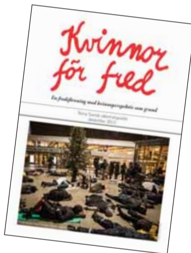
Medlemmarna fick temanummer om svensk säkerhetspolitik i brevlådan.

KFF-tidningen ska även framledas ges ut som inlägga i Miljömagasinet (fyra gånger om året). Dessutom planeras minst ett separat temanummer. Nästa ska vara klart före Almedalsveckan och ha som tema Kvinnor för fred i de nordiska länderna, en historik. Detta med anledning av att svenska Kvinnor för fred fyller 35 år. Första temanumret