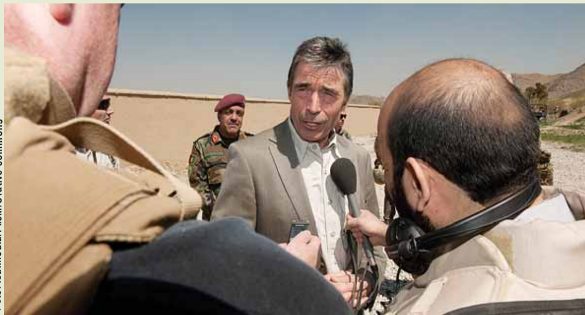
Natochefen Anders Fogh Rasmussen ute på fält i Afghanistan. Till Folkoch försvar kom han i helikopter och talade sig sedan varm för ett svenskt medlemskap i Nato.

Försvarsminister Karin Enström inledde den andra dagen