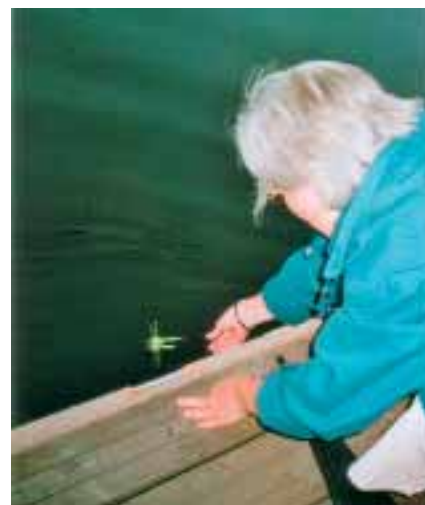
Utsättning av lyktor i Laholm