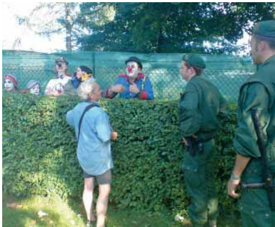
Clowner mot kärnvapen gjorde poliserna nervösa.