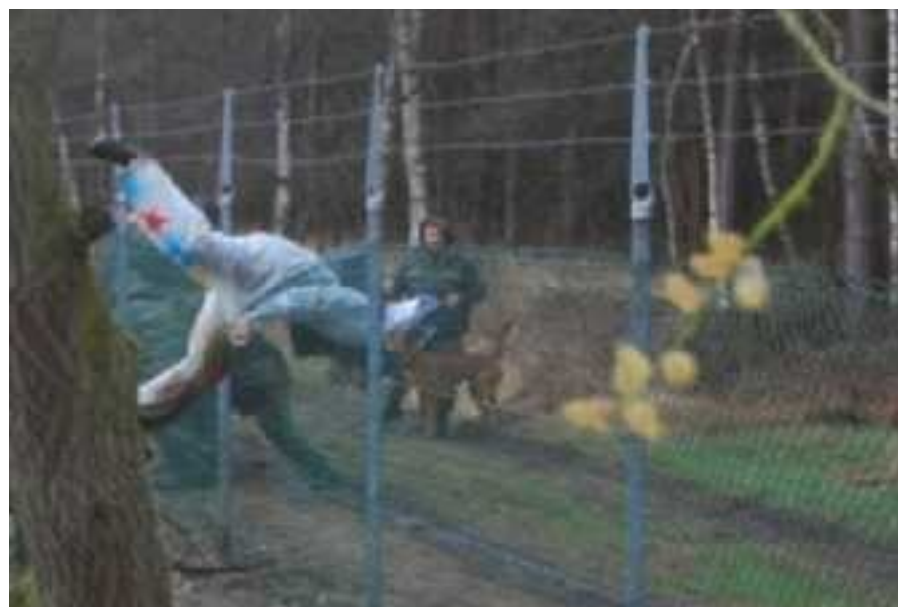
En fredsaktivist från Ofog tar sig in på övningsområdet i Vidsel.