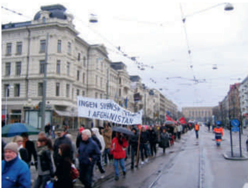
Afghanistanparoll i demonstration i Göteborg i mars 2008.