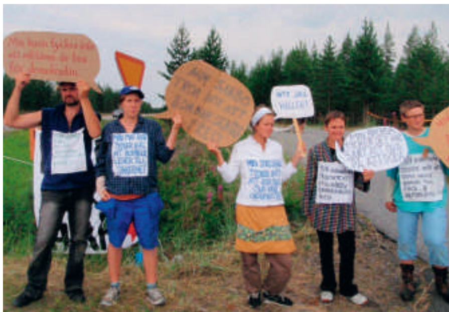
OFOG demonstrerar i Vidsel.