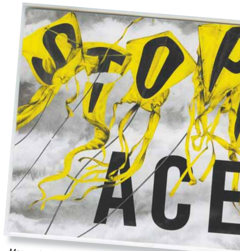
Mer om kampanjen stoppa ACE finns på www.stoppaace.se .

karta hur Ryssland är omringat av USA och Nato med krigsberedda trupper och stridsflyg. Hon belyste även hur de framtida satellitkrigen kan genomföras genom de olika så kallade forskningsstationer som finns utplacerade runt Arktis. Vid slutet av anförandet lyfte både Agneta Norberg och My Leffer fram varningar för ACE, Artic Challenge Exercise.