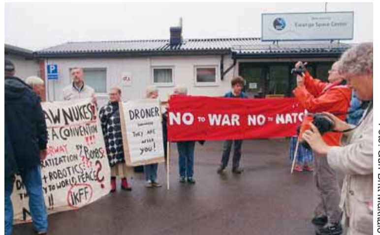
Demonstration i samband med konferensen i Kiruna.