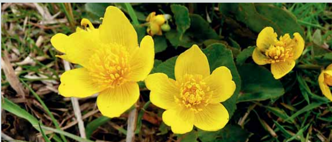
Vi borde till exempel värna naturen, möta klimathotet och utjämna världens klyftor i stället för att rusta upp militärt, tycker den aktiva fredsrorelsen på ön Orust utanför Göteborg.