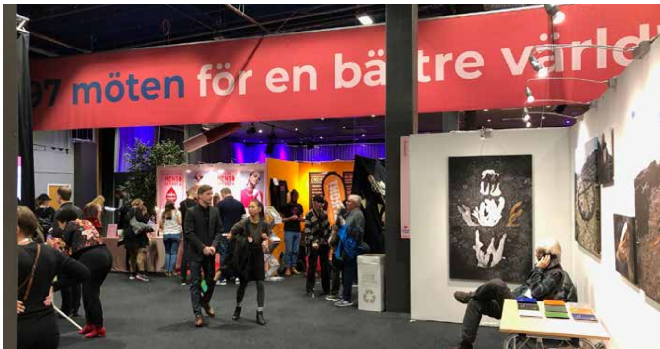
Kvinnor för fred fanns som vanligt på plats på Bokmässan i Göteborg, med monter uppe på Globala torget.