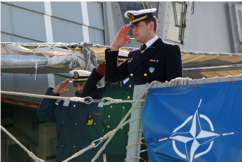
Spänningarna har ökat i östra Europa och Nato har ökat sin närvaro. På bilden lämnar Nato hamnen i Tallinn i Estland.

2014 startade Natos strategiska kommunikationscentrum StratCom i