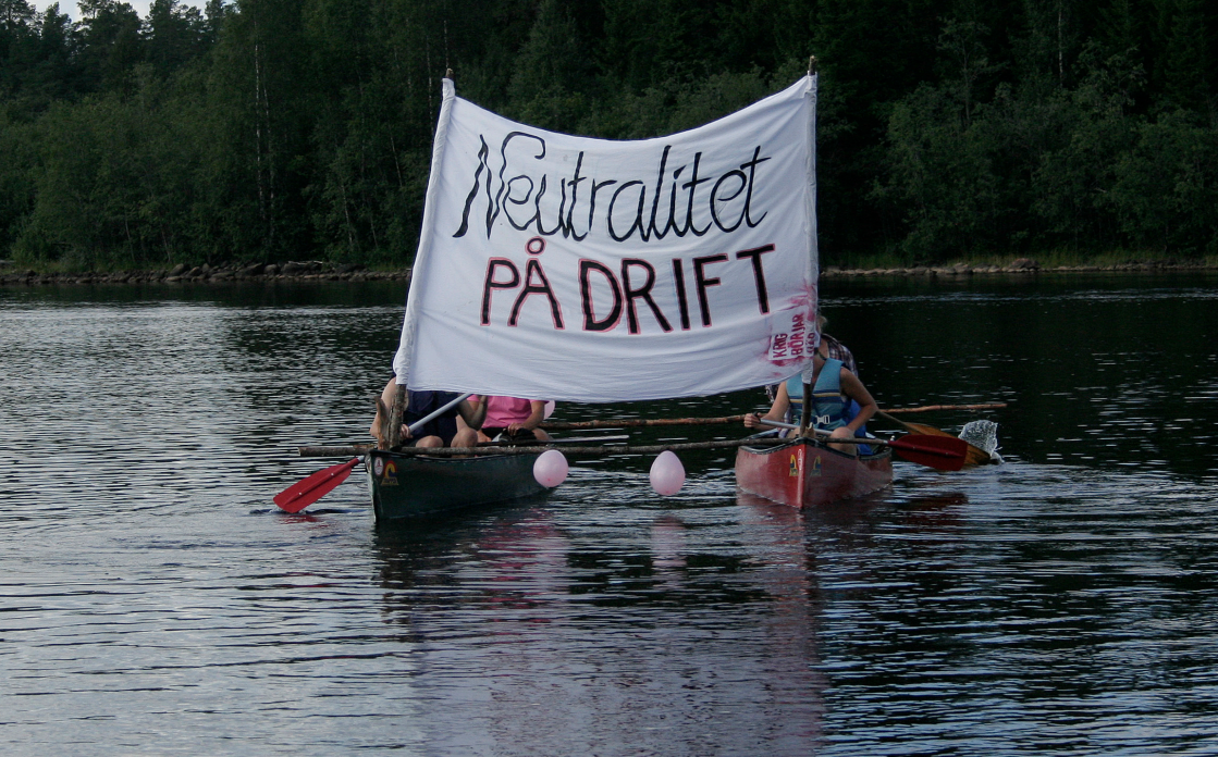
Flottaktion på Lule älv 2011. Sedan millenieskiftet har svensk säkerhetspolitik förändrats radikalt och glidit allt längre bort från den tidigare neutralitetspolitiken.

Därför presenterades begreppet ”gemensam säkerhet”, som skulle fungera som ledande princip. Samarbete skulle ersätta konfrontation för att lösa intressekonflikter.