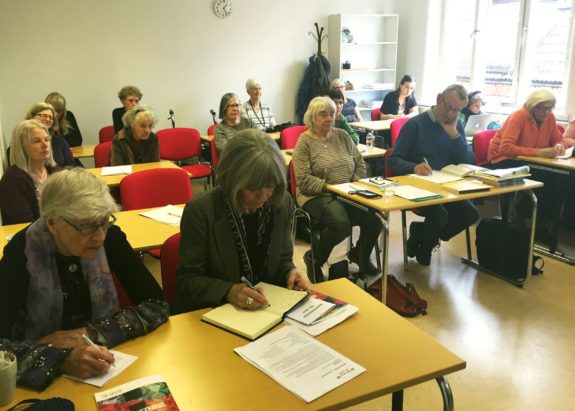
Seminarieriet "Säkerhet – i vems intresse?" i Uppsala 26/4-16.

också militärt försvar. Men först när allt annat provats det vill säga i sista hand kommer militära metoder in. Säkerhetspolitik är att förebygga konflikter och att lösa dem - inte att utkämpa dem. Säkerhetspolitik är först och främst icke-militär.