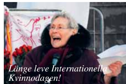
Länge leve Internationella Kvinnodagen!

Kvinnornas kamp måste fortsätta mot allt som begränsar kvinnors liv och rörelsefrihet och kvinnors rätt till ett eget liv - mot hedersmord - misshandel - könsstympning - tvångsaktenskap och våld mot kvinnor som en accepterad krigsstrategi - kampen måste fortsätta!