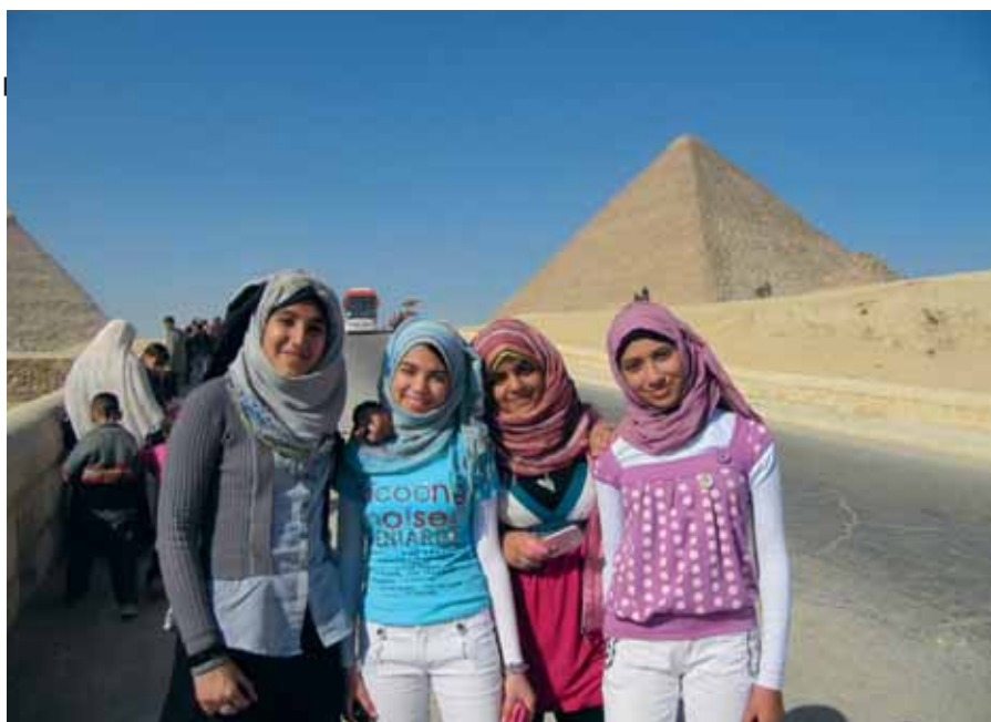
Egyptens framtid är flickorna.