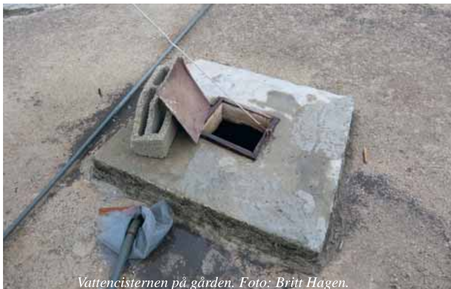
Vattencisternen på gården.

All överflyttning av den ockuperande maktens befolkning på ockuperat område är olagligt enligt folkrätten (Fjärde Geneve konventionen).