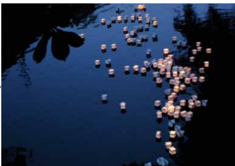
Tända lyktor på Fyrisåns vatten på Hiroshimadagen 2011.