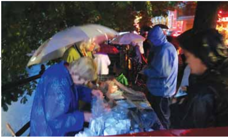
Trots ihållande regn var stämningen god vid Nybron i Uppsala.