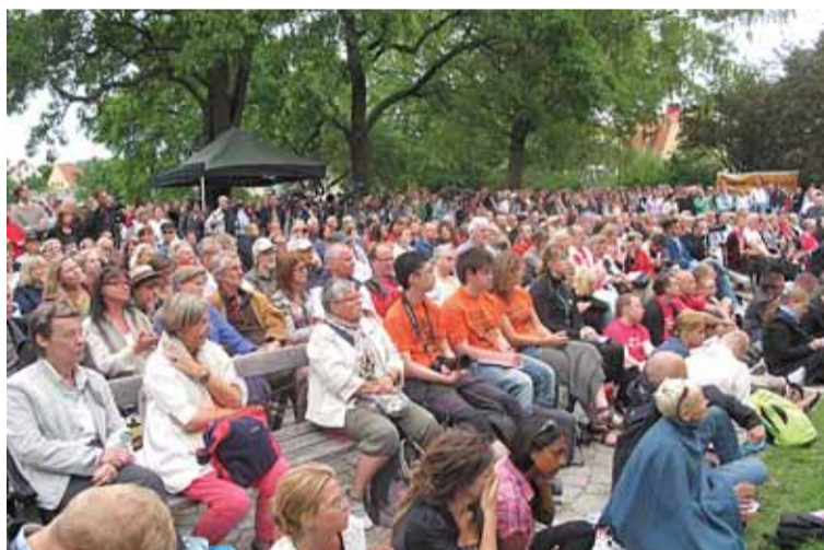
Politikerveckan i Almedalen drog mycket folk även i år. Kvinnor för fred fanns på plats, för samtal och utdelning av material.

– Jag blev smått chockad över okunnigheten och bland vissa, bland annat Röda Korsare, finns ett starkt stöd för övningarna. – Vi måste ju kunna försvara oss mot fienden! – Vilken fiende? – Ryssen! – Vad säger du om USA och Kina? – Dom samarbetar vi ju med. Så det gamla rysspöket lever än, var Gunaino Enqvists slutsats.