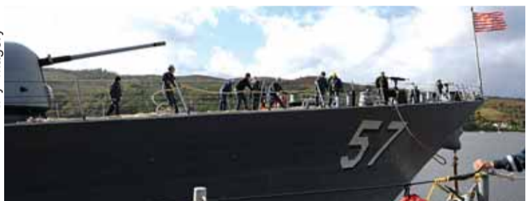
Stridsskepp från nio länder deltar i övningen Joint Warrior.