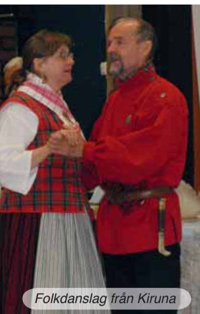
Folkdanslag från Kiruna