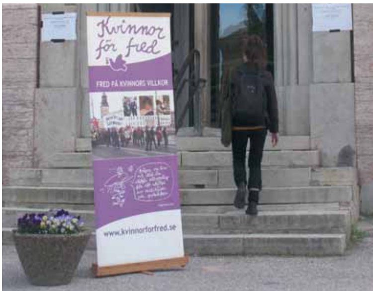
St Hansskolan mitt i Visby var tidigare platsen för Alternativa Almedalsveckan. De senaste åren har saknat ett sådant arrangemang men ideella föreningar har fyllt huset med aktiviteter.

Hela debatten på 1,5 timme finns på Kvinnor för freds Youtubekanal: http://www.youtube.com/watch?v=6GMnOu_VqIY .