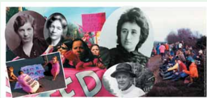
Genom föreläsningar, filmvisningar och samtal söker vi svar på frågan vad vi kan lära från hundra år av fredsarbete.

Genom föreläsningar, filmvisningar och samtal svarar vi på frågan om vad vi kan lära av kvinnor som arbetat för fred under andra tider – för freds-