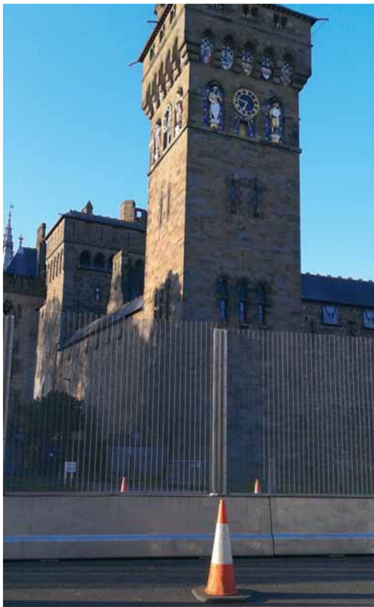
Två mil glasmur var placerad där mötet hölls och runt slottet där delegaterna åt middag en kväll. 10 000 poliser fanns på plats.

Nästa toppmöte kommer att ske i Polen 2016.