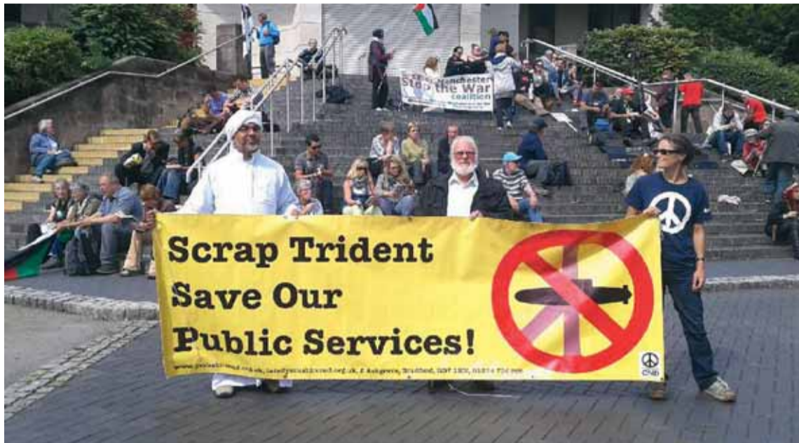
Cirka 2 000 demonstrerade mot Natos militära satsningar (på bilden mot brittiska kärnvapen) som ställdes mot nedskärningar i välfärden. Bara säkerheten för mötet kostade 500 miljoner kronor.

Natomötet uttalade sig för en starkare försvarsindustri i Eu-