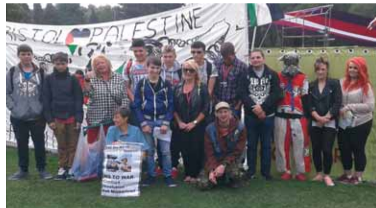
Fredslägret i staden Newport där Natomötet hölls. Två veckor tidigare arrangerades ”Nato cultural festival” med uppvisning av vapensystem och möjligheter för barn att leka med gevär,

I samband med att Warszawapakten lades ner 1991 borde