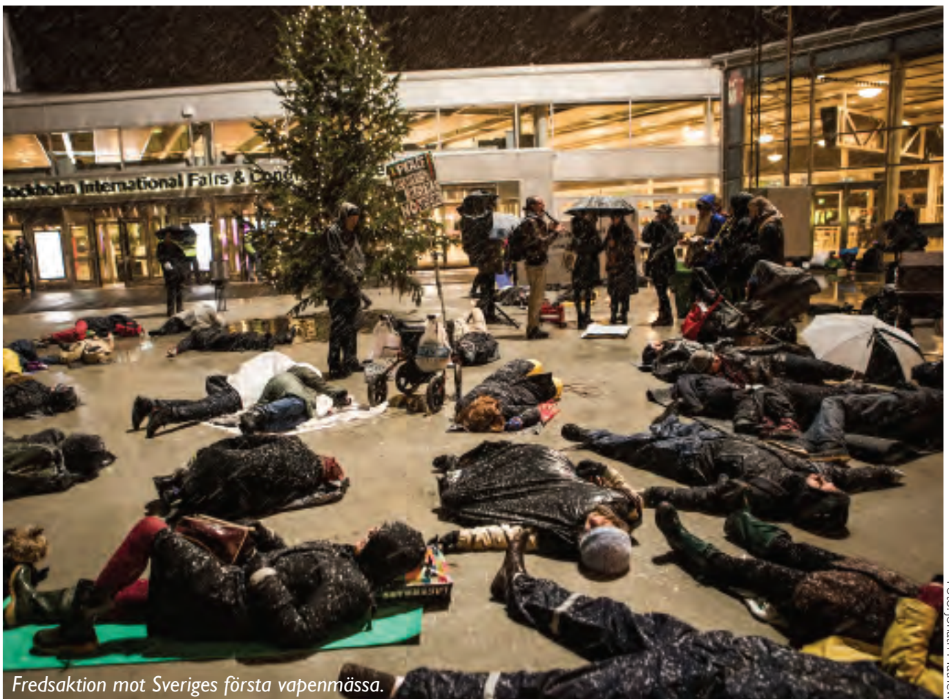
Fredsaktion mot Sveriges första vapenmässa.

Tema: Svensk säkerhetspolitik december 2012