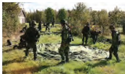
Värnplikten avskaffades 2010.

Sveriges riksdag beslöt i juni 2009 med en mycket knapp majoritet (153 röster mot 150) att Sverige skulle avskaffa den allmänna värnplikten i fredstid och från 2010 ersätta den med en frivillig militär grundutbildning också kallad GMU.