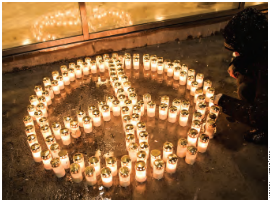
Uppmaning till fred utanför Sveriges första mässa för marknadsföring av svensk vapenindustri, i Stockholm, november.

Sedan flera år tillbaka är vapenindustrin i Sverige inte längre svenskägd – många utländska intressen finns representerade.