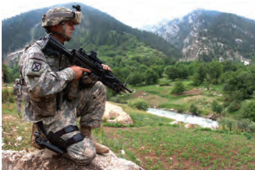
Afghanistan är efter mer än tio års krigsinsats inte närmare fred.

mot civila ”möjligen kan utgöra brott mot mänskligheten”.