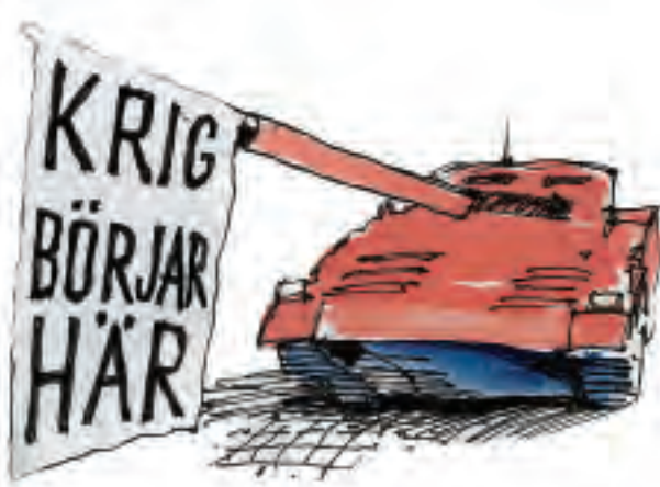
Illustration: Gunnar Svensson

Redan 2004 genomförde Kvinnor för fred i Kiruna protester. Samtliga partier utom vänstern hade tagit beslutet att låta dessa övningar äga rum. Politiker ser dem som en möjlighet att skapa arbetstillfällen.