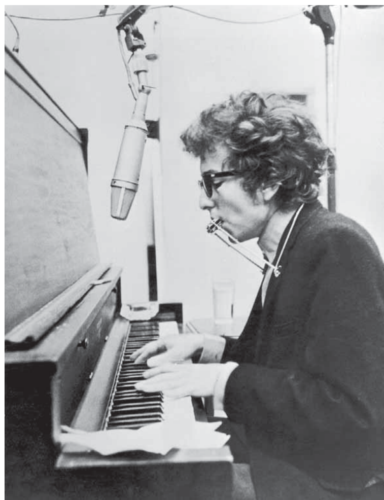
Bob Dylan med piano och munspel, 1960-tal.