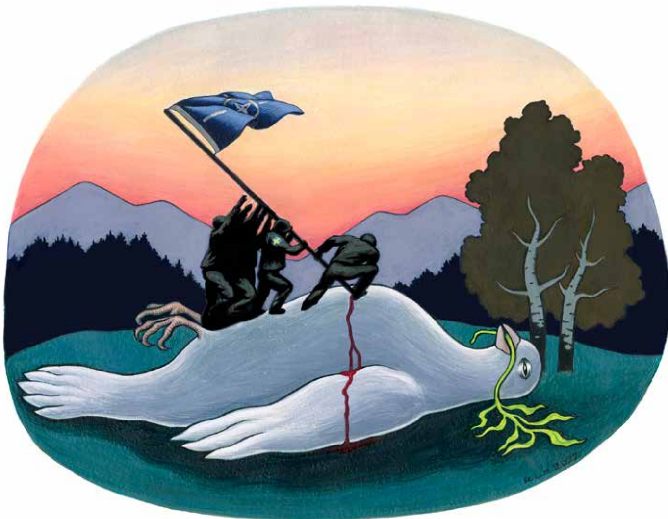
Illustration: : Rebecka L Manzuoli/Moment 2022 – ett upprop mot kärnvapen, upprustning och Natomedlemskap.