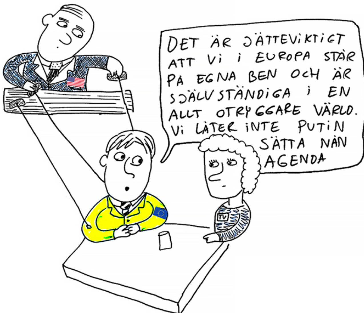
Illustration: Tommy Sundvall/Moment 2022 – ett upprop mot kärnvapen, upprustning och Natomedlemskap.

ka Gotland existerar inte i rapporten. Huruvida Natoanslutning ökar spänningarna kring Gotland föregås med tystnad trots att Gotland skulle kunna förses med Natobaser med missiler etcetera. Skulle detta innebära nedtrappning eller skulle det trigga Ryssland att i en krigssituation snarare vara först med att inta ön för att stoppa Natos trupper att göra detsamma?