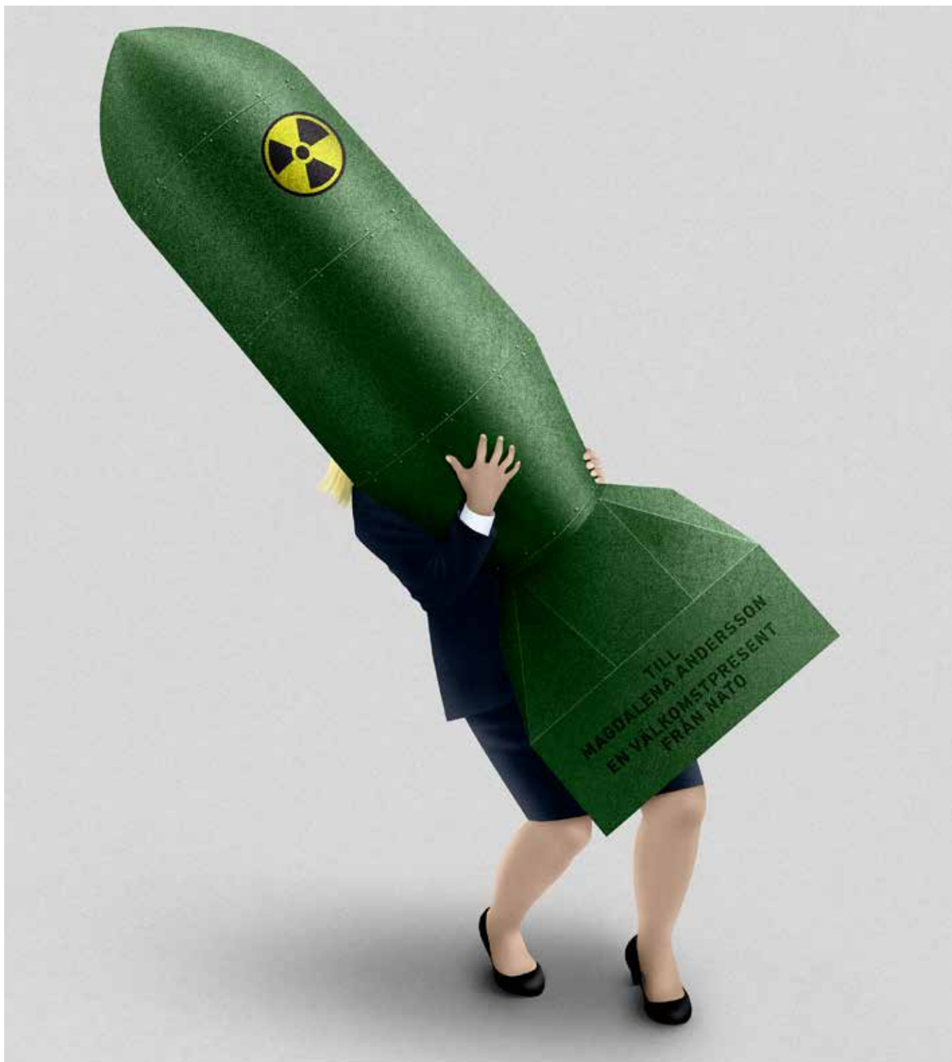
Illustration: : Karin Z. Sunvisson/Moment 2022 – ett upprop mot kärnvapen, upprustning och Natomedlemskap.

är dock i praktiken omöjligt med tanke på vilken roll kärnvapnen spelar i den militära organisationen med globala ambitioner.