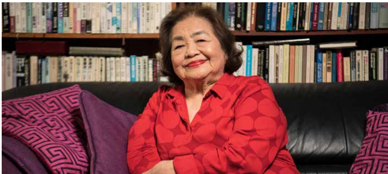
Setsuko Thurlow närvarade på möte om kärnvapen och gav sitt vittnesmål som överlevare – hibakusha – från Hiroshima.