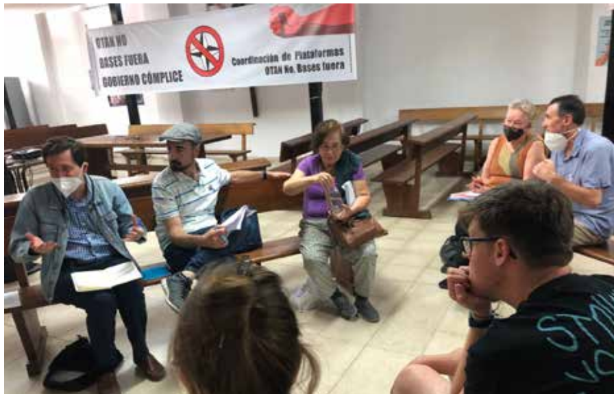
Grupparbete på mötet Counter summit Nato No – Basis Out.

'Nato No – Basis Out' som ordnades av plattformar och grupper som hade undertecknat "Llamamiento a la movilización contra la Cumbre de la Otan" (Uppmaning till mobilisering mot Nato-toppmötet) pågick hela lördagen. Arbetsgrupperna diskuterade ämnen som; Nato och baserna, Nato och EU:s och USA:s imperialism, Spanska statens ansvar och Toppmötet 2022 i Madrid och presenterade en gemensam resolution.