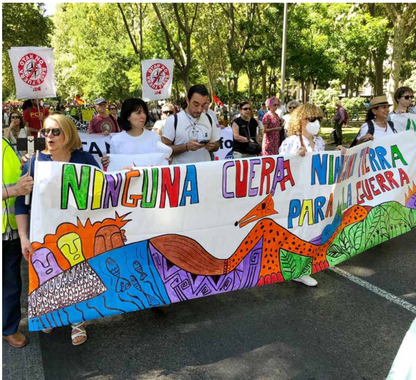
25 000 demonstranter slöt upp och demonstrerade under budskapet "Nej till Nato – Nej till baser" i centrala Madrid.

uttryckets gång på gång. Vid det välbesökta evenemanget om detta ämne välkomnades den nya Olof Palme-rapporten sammanställd av International Peace Bureau (IPB), World Trade Union Confederation (ITUC) och Olof Palme International Center. Rapporten utgör en utmärkt grund för att utveckla en ny säkerhetsarkitektur för Europa och världen.