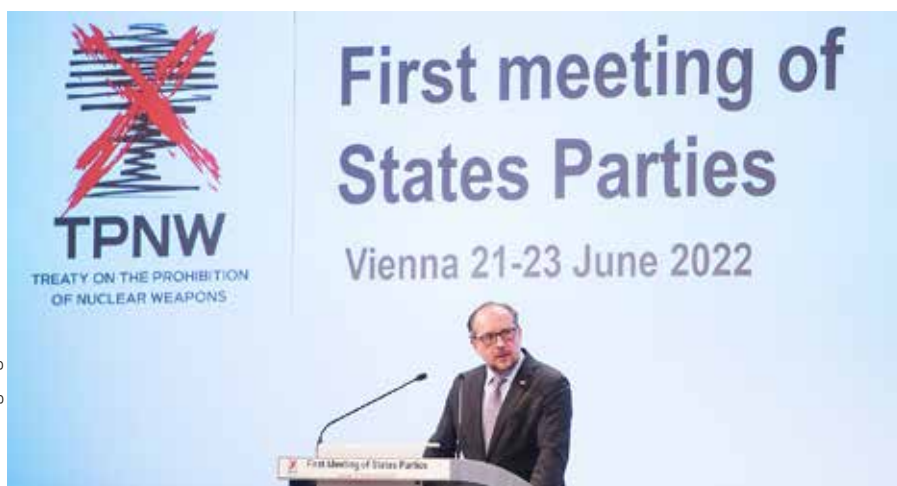
Den österrikiske politikern Alexander Schallenberg i talarstolen på det första TPNW-mötet.